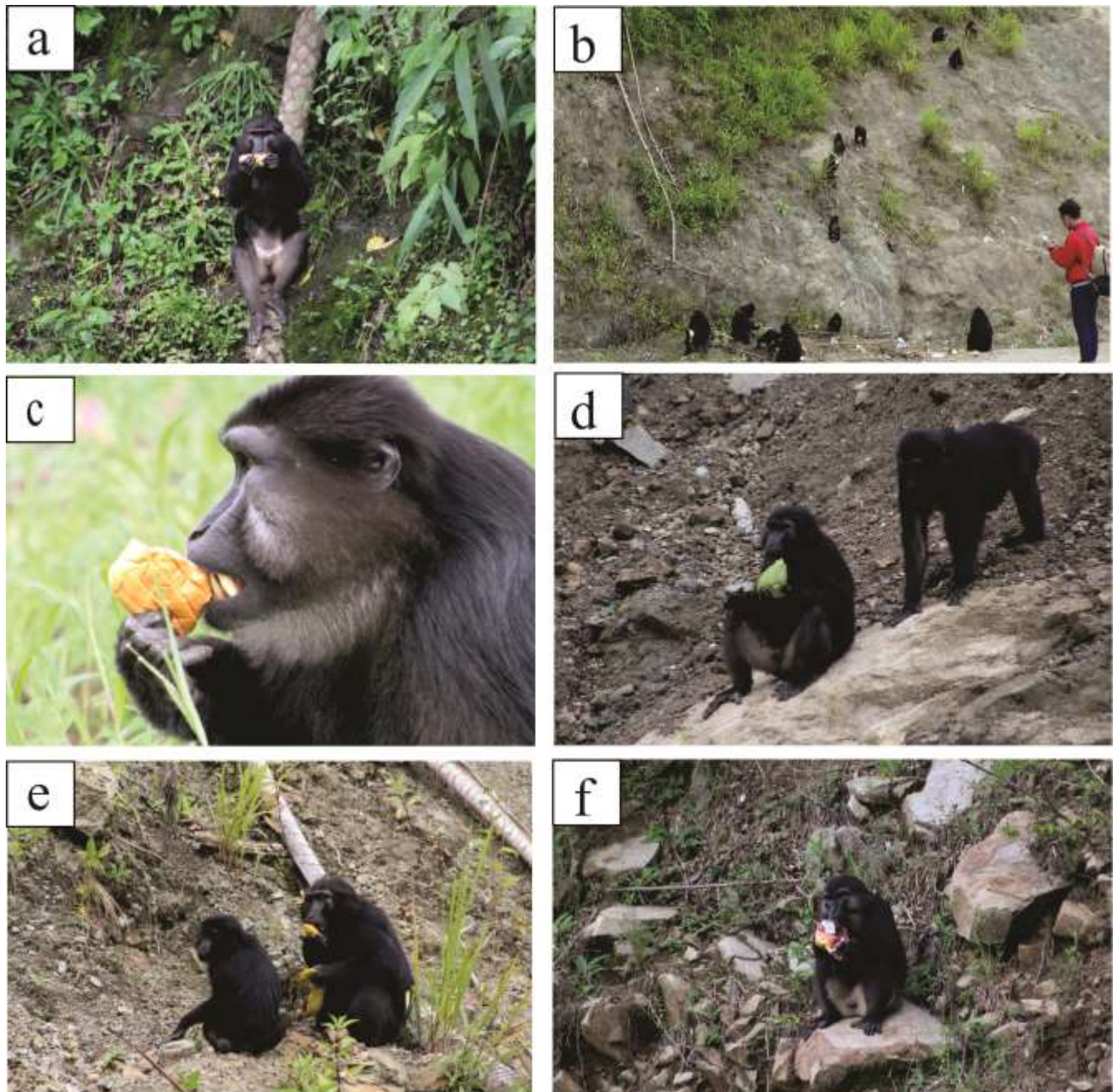
Gambar 3. Macaca mengkonsumsi pakan non-alami atau pakan yang diberi oleh pengunjung berupa jagung (a), pisang (b), roti (c), labu siam (d), mangga (e) dan kripik (f).

Tiga pakan dengan persentase terendah dengan nilai yang sama (0,35%)