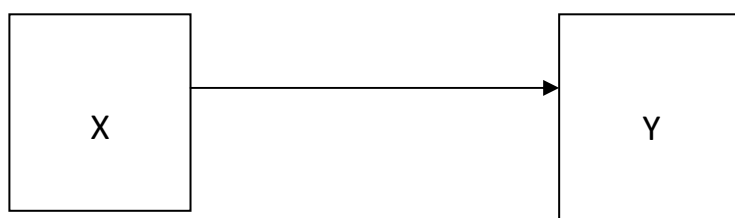
Gambar 3.. Rancangan Penelitian