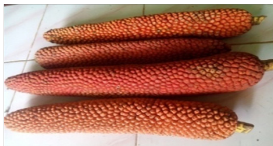
Gambar 1. Buah Merah ( Pandanus Conoideus De Vriese ) Asal Kabupaten Poso

Di daerah Sulawesi Tengah yaitu di daerah Kabupaten Poso, Kecamatan Pamona Selatan, Desa Mattirowaslle juga tumbuh tanaman buah merah ( pandanus conoideus De Vriese ).